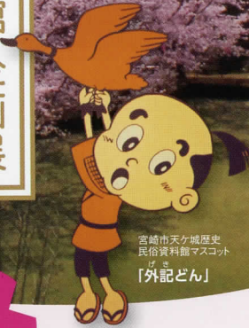
宮崎市天ヶ城歴史民俗資料館マスコット 「外記どん」